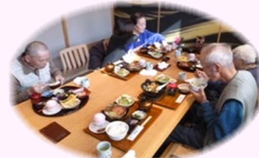
城彩苑でのお食事会