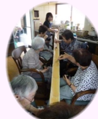
夏に美味しい! そうめん流し