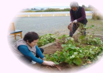
さつまいもの収穫