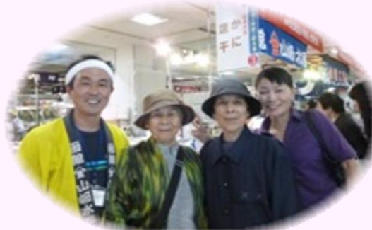
県民百貨店の物産展

四季折々の催し物、趣味や特技を活かした活動を 利用者さんと一緒に計画を立て、行っています