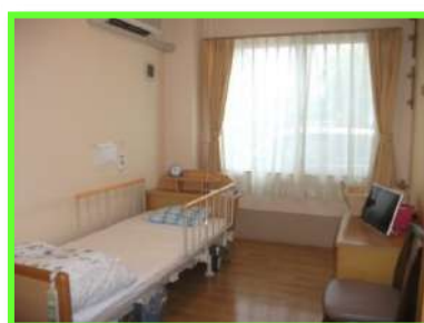
安心して快適に 泊られます