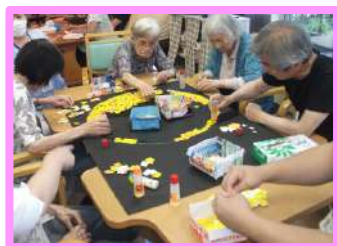
創作と イベントの 様子