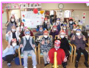
笑顔がこぼれる時間を 大切にします