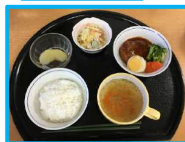
安全な生活を 支えます

【小規模多機能ホーム】とは・・・自宅での暮らしを続けられるように、一人ひとりの希望や介護が必要な状況に応じ「 通い 」を中心に自宅への「 訪問 」、施設での「 泊り 」を組み合わせ利用ができます。電話による見守りなども可能です。