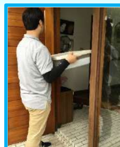
食事 配達の様 子